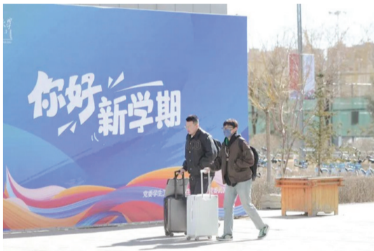
2月24日至26日,宁静的校园陆续迎来返校学生,2023年春季学期正式开启。