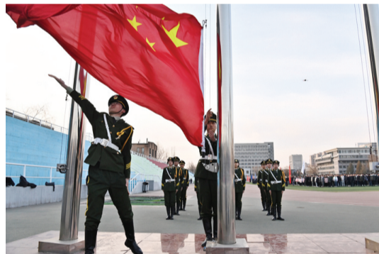
3月6日,学校举行2023年春季学期“开学第一课”升旗仪式。