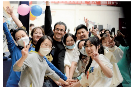
3月8日,学校举办“奋进新征程、巾帼建新功,喜迎‘三八’国际妇女节”大型游艺拓展活动。