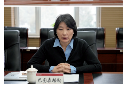
学院和材料科学与工程学院负责人参加座谈。